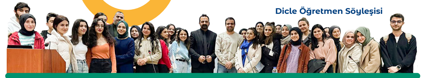
Dicle Öğretmen Söyleşi