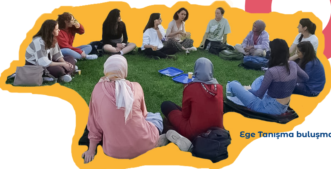
Ege Tanışma buluşması