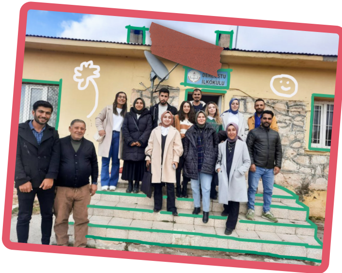
Van Köy Ziyareti